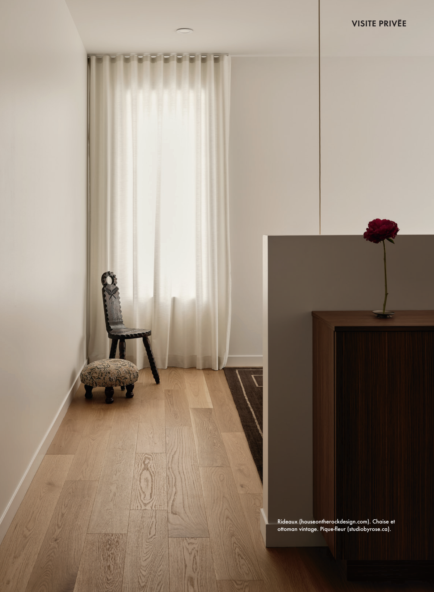
Rideaux ( houseontherockdesign.com ). Chaise et ottoman vintage. Pique-fleur ( studiobyrose.ca ).