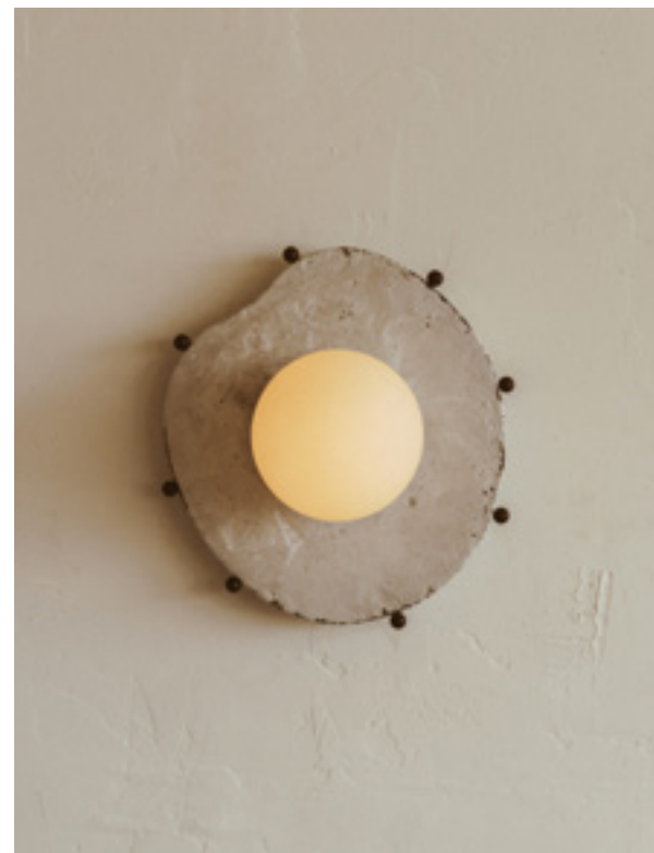
Miroir en aluminium brut avec des boutons en laiton. À droite, lampe Nopal 1205-LA40 , en aluminium. Page de droite, miroirs en laiton et aluminium fondus et coulés dans du sable. Au bas de l'étagère, peigne en bronze au manche en forme de coquillage.

à-tout a vu le jour au Costa Rica. Ses parents d'origines française et suisse, qui ont fait carrière dans le tourisme, ont contribué à aiguïser sa curiosité, avant qu'il se tourne vers des études en design graphique à l'UQAM (Université du Québec à Montréal). C'est avec des lampes et des sculptures réalisées à base de matériaux récupérés qu'il se fait connaître, au cœur de la pandémie. Puis par une table de jeu d'échecs dont l'idée lui est venue grâce à la série Le Jeu de la dame (2020). Sa chaise Hublot , dévoilée lors du salon Complètement Design, au printemps 2024, dans le Vieux-Port de Montréal, s'impose déjà comme un objet emblématique de la jeune garde du design québécois. Inspirée par le milieu balnéaire et l'architecture brutaliste, elle se décline